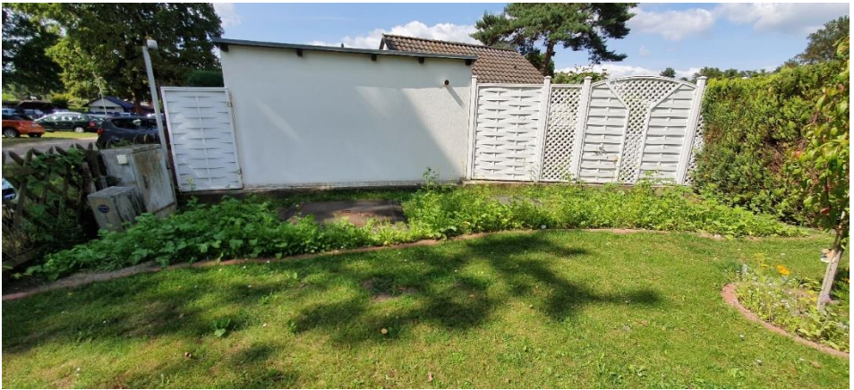
Die Bienenwiese wächst

Die ersten Früchte konnten auch schon geerntet werden. Der Pfirsich hat es geschafft drei Früchte bis zur Ernte zu behalten. Der Kirschbaum hatte einige Kirschen mehr zu bieten. Die beiden Apfelbäume haben es im vergangenen Jahr noch nicht geschafft ihre Äpfel zu halten. Wir schauen gespannt was dieses Jahr bringt.