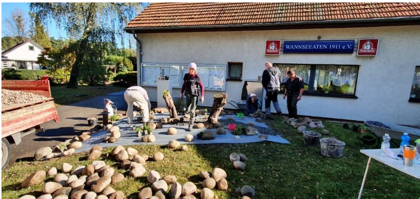
Die ersten Steine finden ihren Platz

Dabei wurde schon geplant, wo welche Pflanzen hinkommen sollten und Stück für Stück entstand eine kleine Steingartenlandschaft, die nun einen kleinen alpinen Garten darstellt. Alles in allem haben wir an zwei Tagen ca. vier Tonnen Steine von Hand bewegt.