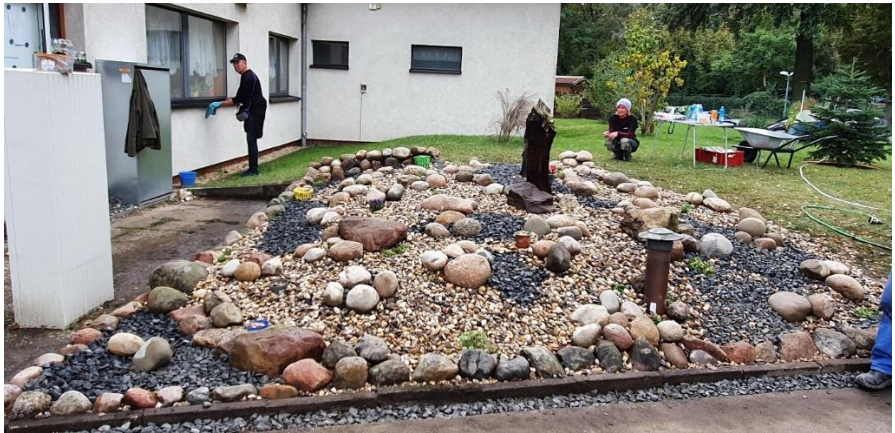
Ein letzter prüfender Blick 😊