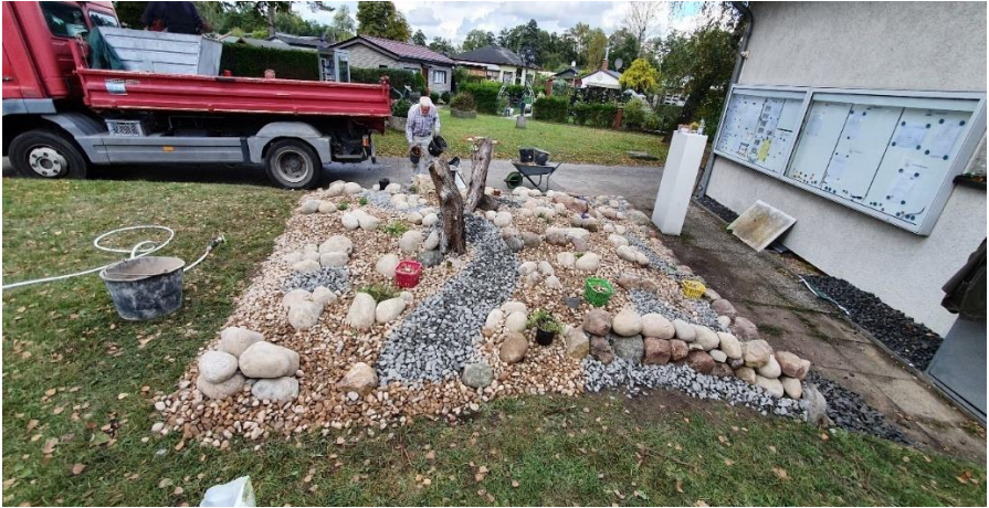
Der LKW ist leer