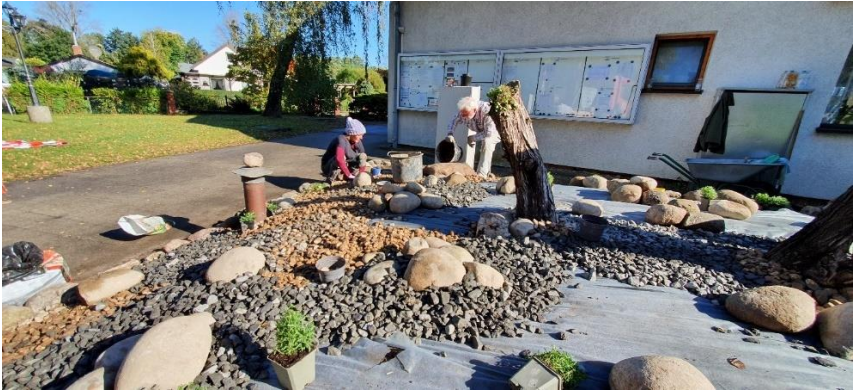
Stück für Stück nimmt alles Form an