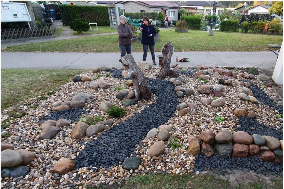
Erste interessierte Blicke