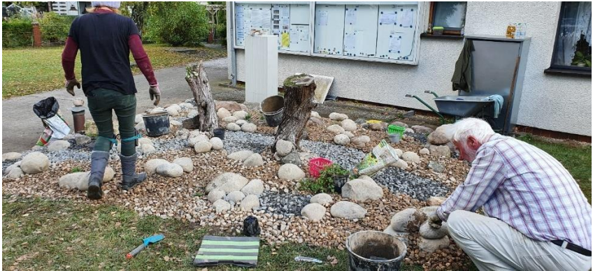
Die Pflanzen finden auch ihren Platz