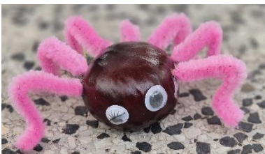
Spinne Thekla und ihre Armee