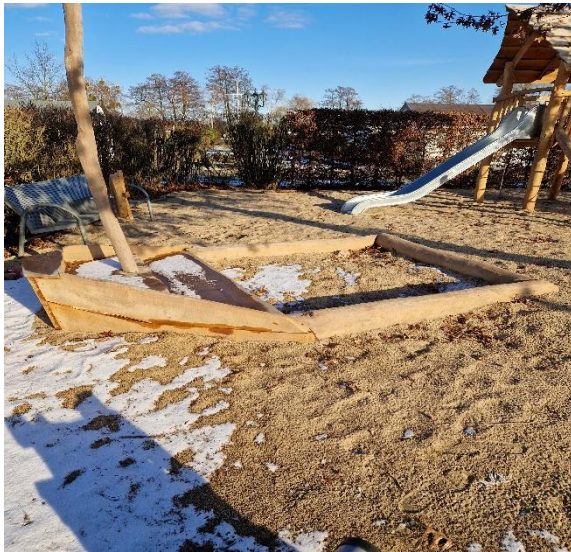
ein maritim gestalteter Buddelkasten und