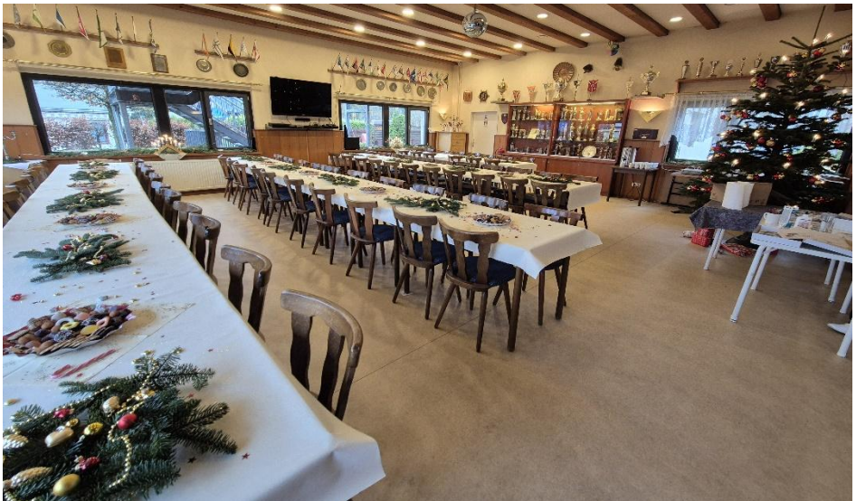
Die Ruhe vor dem Sturm 😊

Da beginnen wir wie jedes Jahr mit unserer Weihnachtsfeier und wir haben uns auch wieder Gedanken gemacht, damit unsere Kids, egal ob groß oder klein, viel Spaß beim Basteln haben.