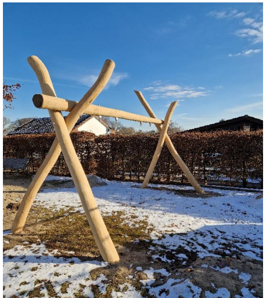
eine neue Schaukel, auch mit einem Kleinkindsitz.

Alle Geräte entsprechen der der DIN-Norm EN 1176 für den Betrieb eines öffentlichen Spielplatzes und werden jährlich von einem Gutachter abgenommen.